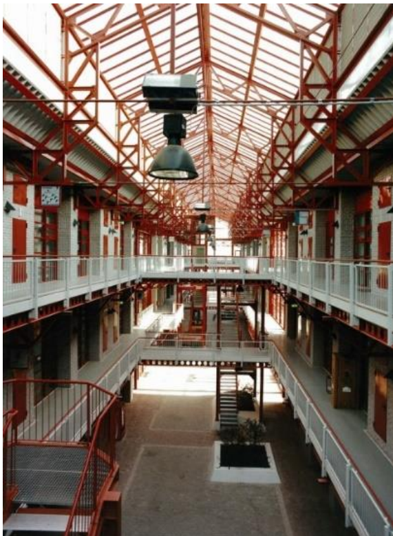
Blick in den Lichthof eines unserer Häuser

Ob Büro, Werkstatt, Fertigungsfläche, Versuchsfeld oder Schulungsraum – das IGZ Magdeburg bietet innovativen Unternehmen aus nahezu allen Branchen gute Entfaltungsmöglichkeiten.